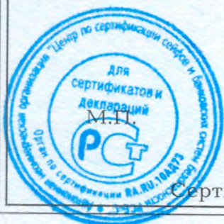
Схема сертификации - 1с